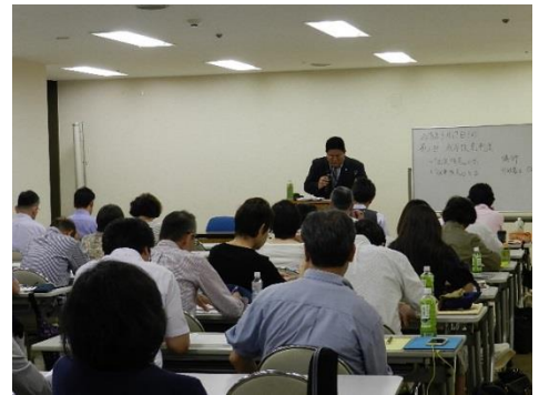
「講座風景」 暑い中、たくさんの方がご出席されました。